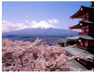
สัญลักษณ์ของแดนอาทิตย์อุทัย