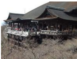
ดื่มน้ำศักดิ์สิทธิ์ 3 สาย