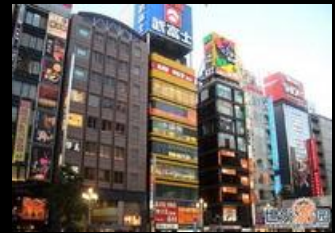
แหล่งช้อปปิ้งทันสมัย