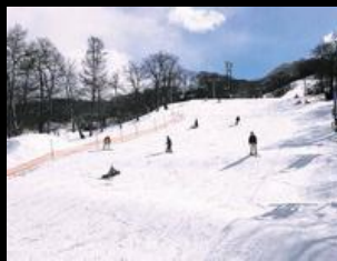
ลานสกีสุดหรู