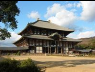
นมัสการ หลวงพ่อโต (ไดบุทซึ)