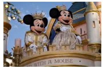
สวนสนุกระดับโลก